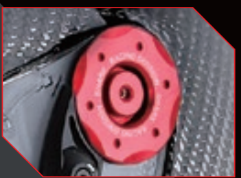
シールドベースに《SHARK Racing Division》のレーザー刻印