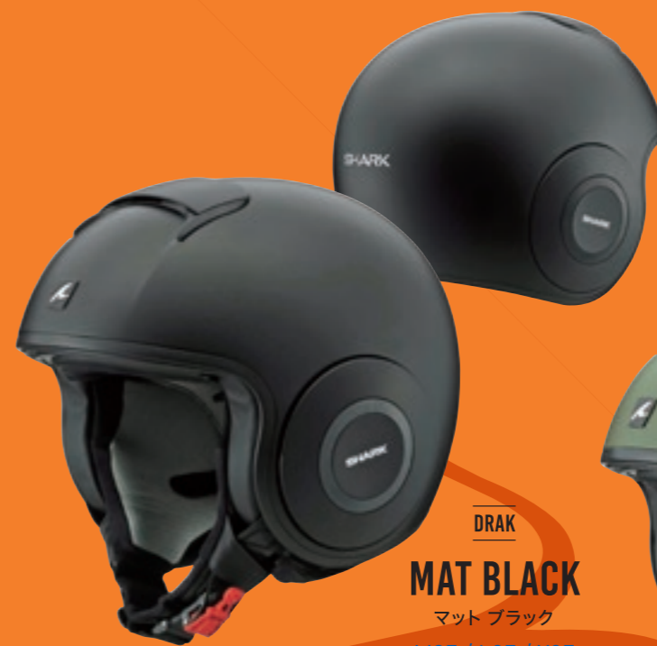
DRAK MAT BLACK マットブラック M37 / L37 / X37