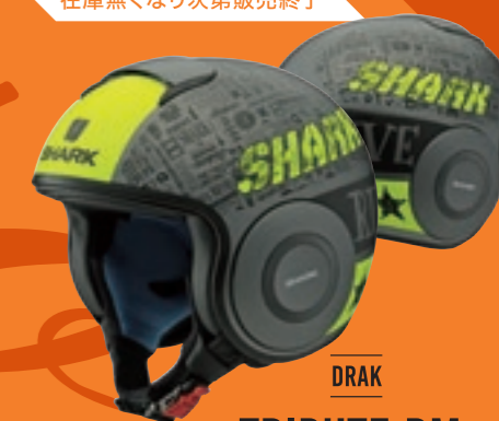
DRAK TRIBUTE RM SILVER/YELLOW トリビュート アルエム シルバー/イエロー M62 / L62 / X62