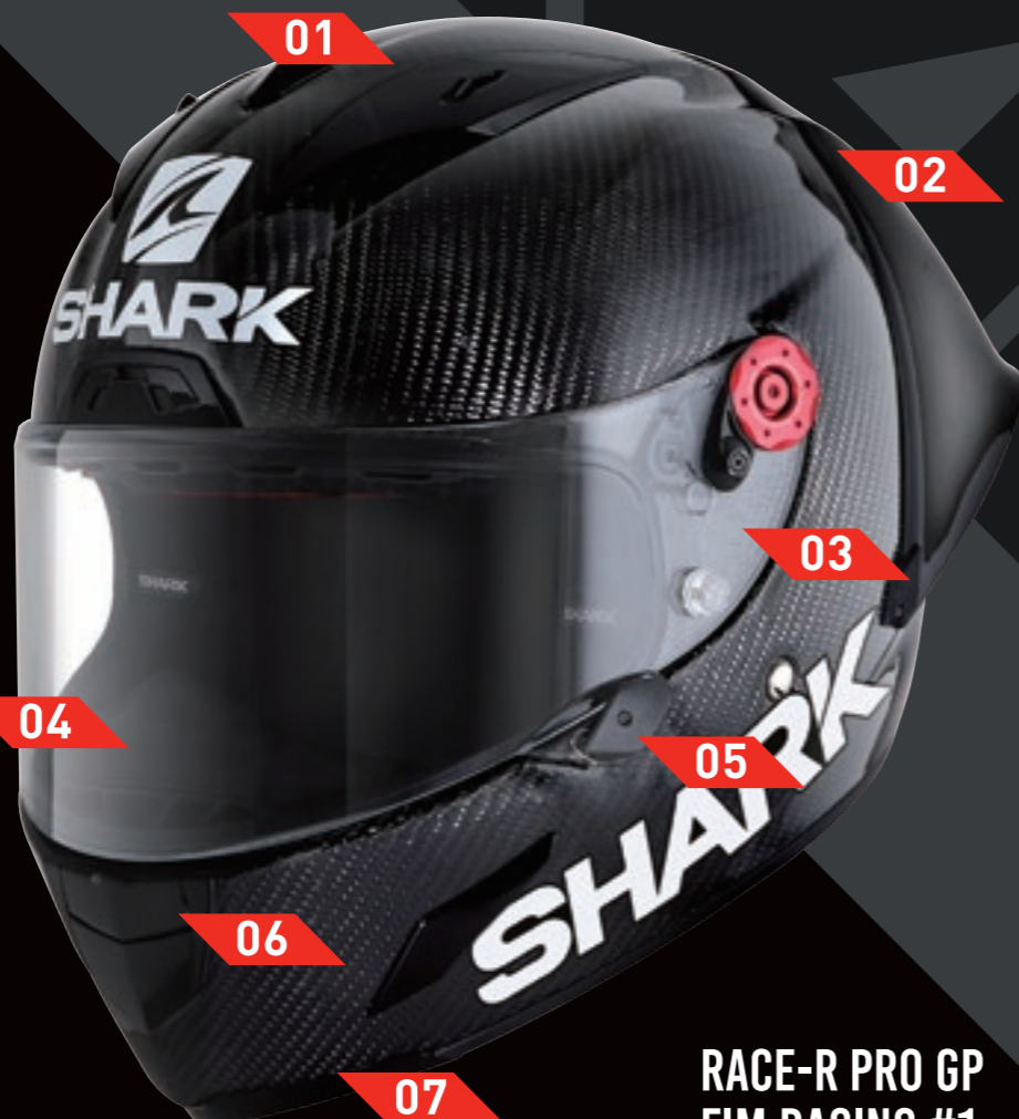
RACE-R PRO GP FIM RACING #1 » P7