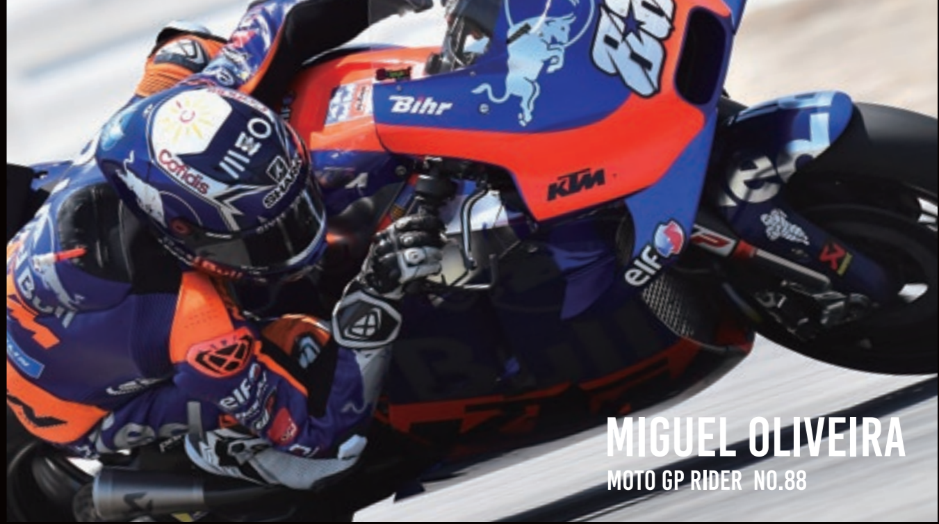
MIGUEL OLIVEIRA MOTO GP RIDER NO.88