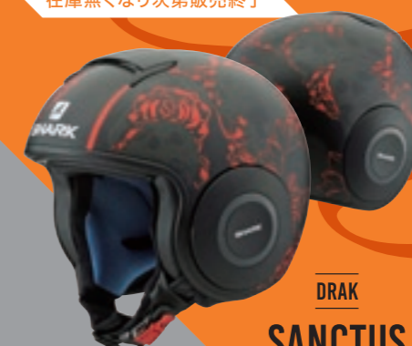
DRAK SANCTUS MAT BLACK サンクタス マット ブラック M17 / L17 / X17