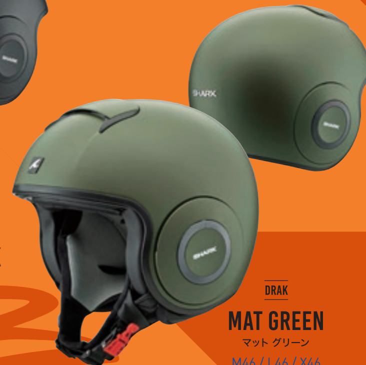
DRAK MAT GREEN マットグリーン M46 / L46 / X46