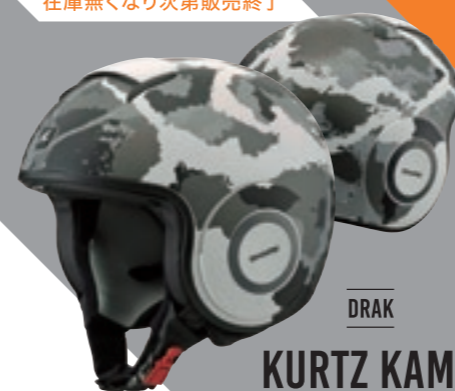
DRAK KURTZ KAMO カーツ カモ M76 / L76 / X76