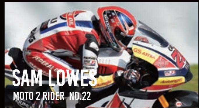
SAM LOWES MOTO 2 RIDER NO.22