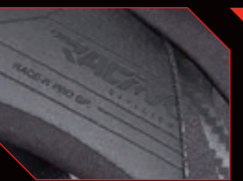
ネックプロテクションに《SHARK Racing Division》のレーザー刻印