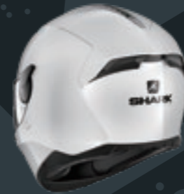
D-SKWAL2 WHITE ホワイト