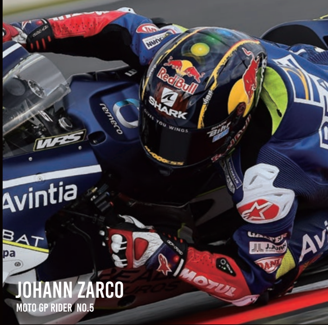
JOHANN ZARCO MOTO GP RIDER NO.5