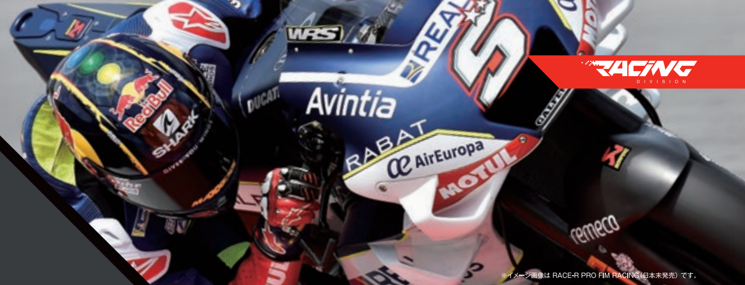
*イメージ画像は RACE-R PRO FIM RACING (日本未発売) です。

◀SHARKが世界初の全サイズFIM認証規格「FRHPhe-01」を取得した証。