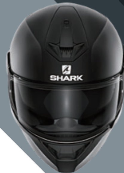
D-SKWAL2 MAT BLACK マットブラック