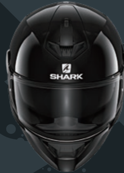
D-SKWAL2 BLACK ブラック