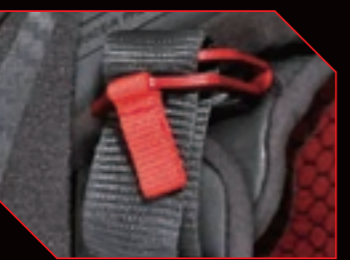
アルマイト加工されたチタン製Dリング